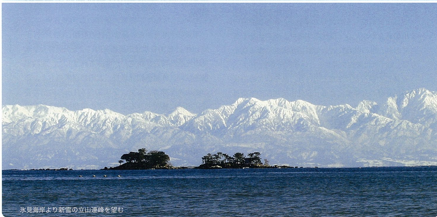
氷見海岸より新雪の立山連峰を望む