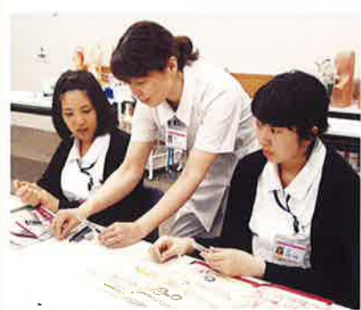
看護部研修 血糖測定器操作方法