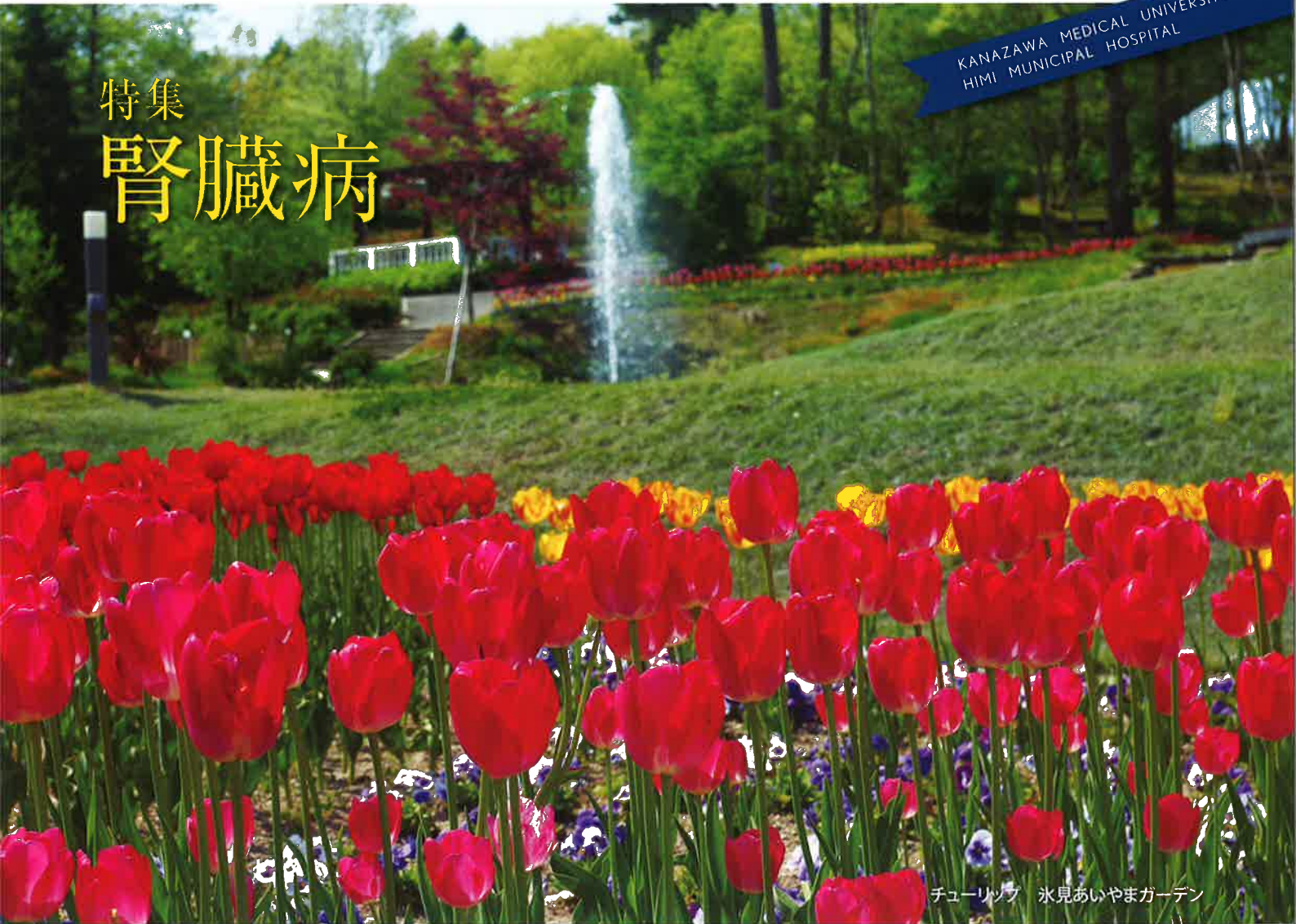
チューリップ 氷見あいやまガーデン