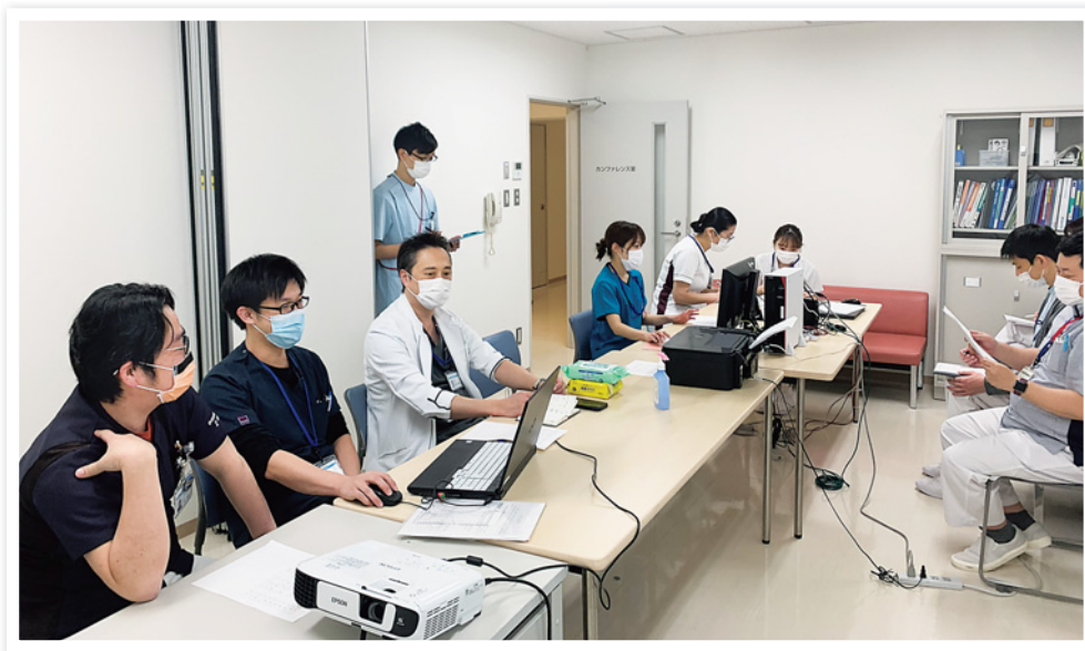
多職種カンファレンスの風景

高齢者を骨折によるADLの低下から救うためには、骨粗鬆症の治療をしっかり行うことが重要です。当院では、外来においても積極的に骨粗鬆症治療の介入を心がけ、骨粗鬆症治療の対象患者が入院された場合には、週一回、多職種カンファレンスを行い、骨粗鬆症治療の導入や治療の継続をどのようにするかを検討しています。骨折から高齢者を守り、健康寿命を伸ばす手助けができるよう、スタッフ一丸となって骨粗鬆症治療に取り組んでいきたいと思えます。