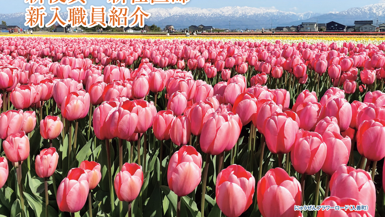
にゅうぜんフラワーロード(入善町)

KANAZAWA MEDICAL UNIVERSITY HIMI MUNICIPAL HOSPITAL