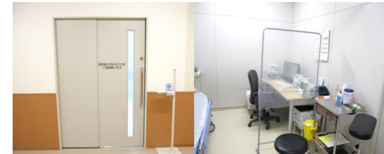
廊下側からの入口

当院では新型コロナウイルス感染症感染拡大防止対策としてこれまで様々な取り組みを行ってきました。当院の「発熱外来」としての診察室ですが救急室の一部に 感染診察室 があります。この部屋は 陰圧設備 が整っており、結核など 空気感染が疑われる疾患の救急患者を診察 するために新病院建設時に設計されました。しかし、廊下側から部屋に入れないという不便さがあり、今回改修工事を行ないました。11月に完成し、使用を開始しています。