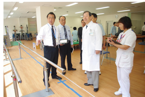
平成 25 年度 病院長安全ラウンド予定表

ラウンド後、結果を評価しラウンド部署へフィードバックをかけて改善に取り組んでいます。