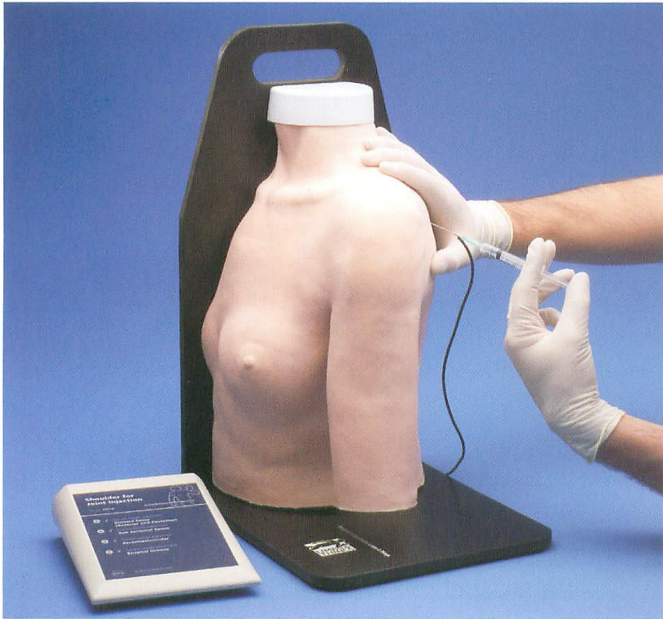
13 0010 肩関節注射モデル