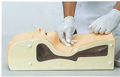
気管切開部からの吸引