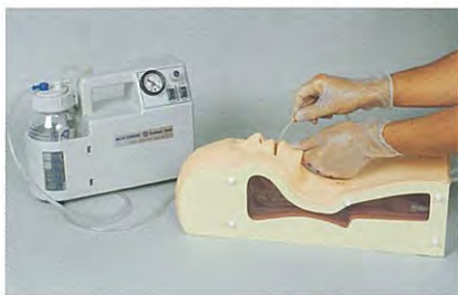
小型吸引器での実習