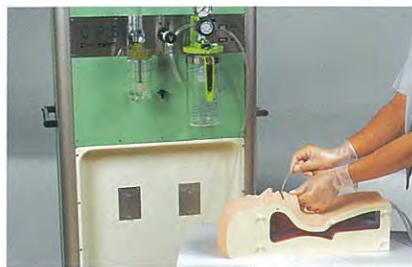
CPS実習ユニットでの実習