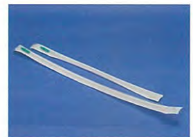
カテーテル 2種組 11229-040

● 製品は内容・仕様・外観などが予告なく変更になる場合がございます。予めご了承ください。一回の御注文が2万円に満たない場合は、別途送料を頂きます。