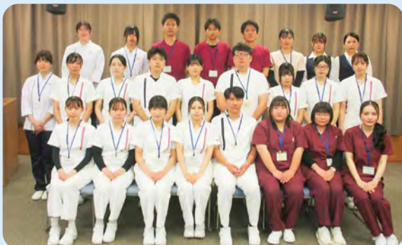
新入職員の皆さん

4月から、新たに8名の医師、4名の研修医を含む34名の新入職員が着任しました。市民の皆様に、より良い医療を提供できるよう努めてまいりますので、よろしくお願いいたします。