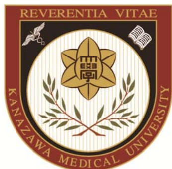
CMYK 配分比率 (%)