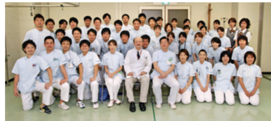
リハビリテーションスタッフ