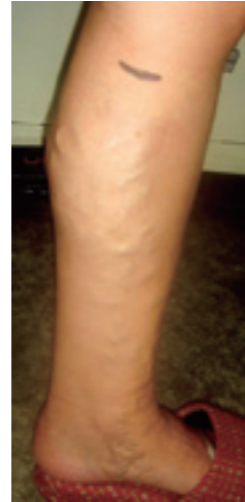
下肢静脈瘤の症状がみられる下肢

下肢静脈瘤とは、静脈内の弁が壊れて静脈血が心臓へ流れずに、逆流して静脈内に血液が溜まって瘤状に膨らんだ病気です。症状としては、足が「むくむ」「だるい」「こむら返り」「慢性的な湿疹」など多彩です。静脈瘤にはいろんなタイプがありますが、手術が必要になるのは“伏在型静脈瘤”と呼ばれるタイプです。原因として最も多い“大伏在静脈（足首から脚の付け根の体表付近の内側を走行する静脈）の逆流による下肢静脈瘤”は、脚の付け根を切開して、大伏在静脈を抜去する手術（ストリッピング術）が今までは主に行われてきました。