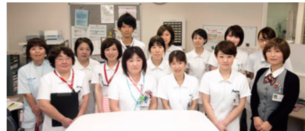
病棟スタッフ写真