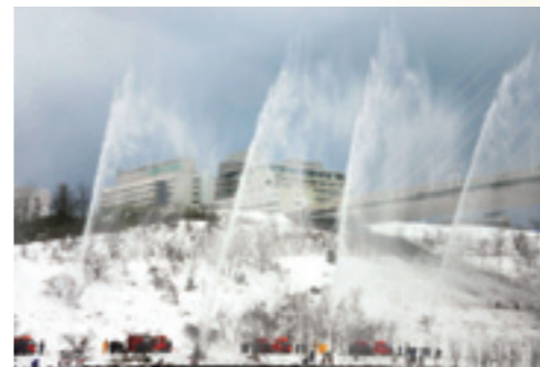
内灘放水路から見た金沢医科大学病院 (1月4日)